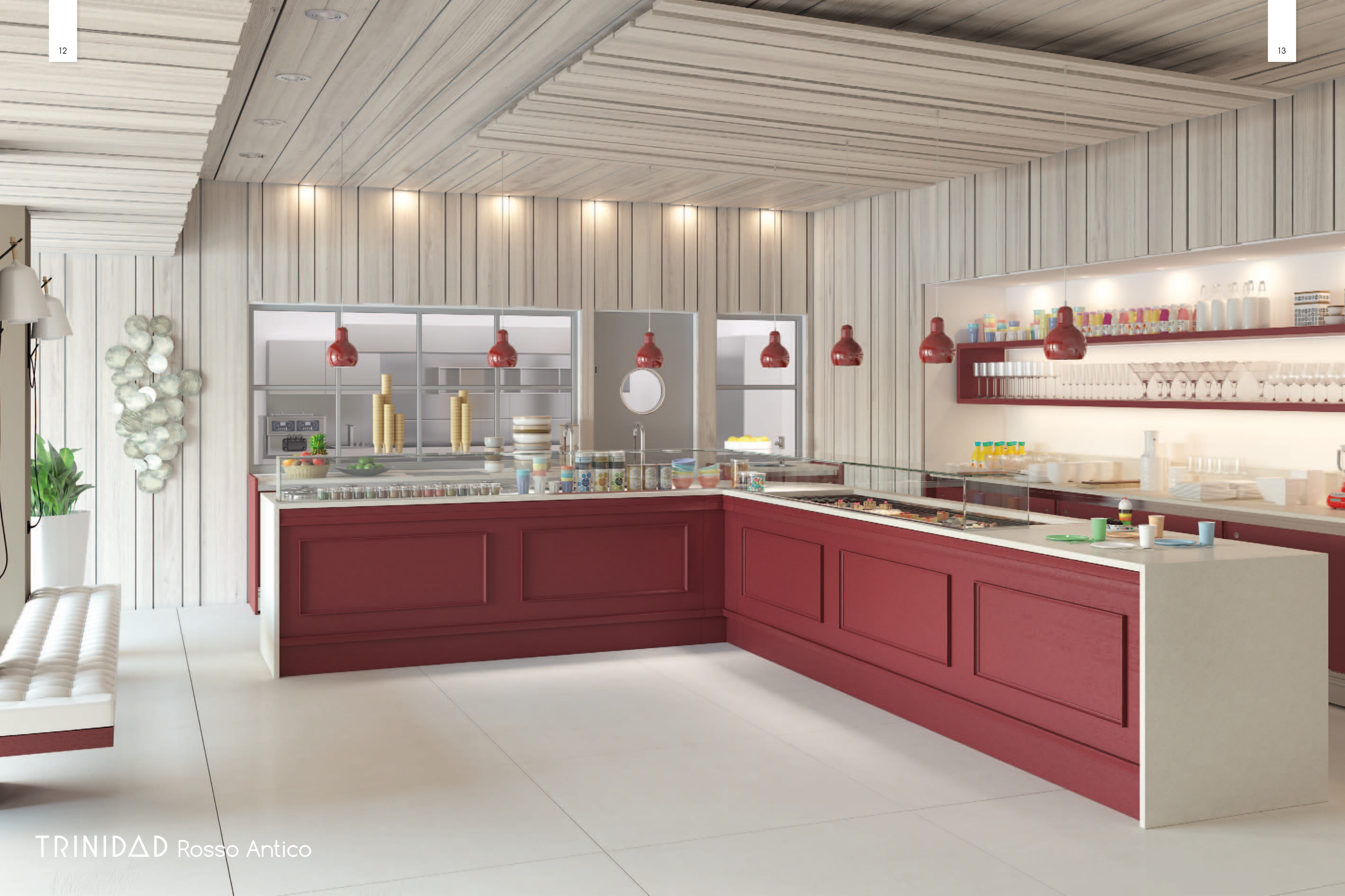
TRINIDAD Rosso Antico